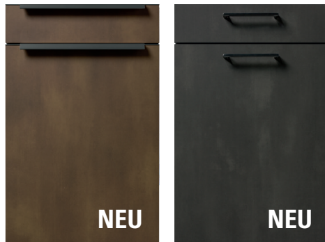
L592 Stahl bronze Nachbildung